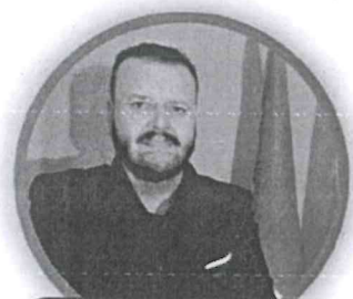
GIUSEPPE FAVILLA SECONDARIA DI SECONDO GRADO

DOCENTI, ATA, INSEGNANTI DI RELIGIONE PER LA SCUOLA