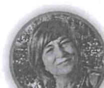
GIOVANNA MARIA BURRELLI SCUOLA PRIMARIA